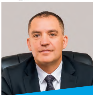
Szanowni Państwo Drodzy Mieszkańcy Gminy Radziejowice

P przed nami piękne chwile – Święta Bożego Narodzenia i powitanie Nowego 2025 Roku. W tym szczególnym czasie, poczujemy – jak szybciej i radośniej zabiją nasze serca, kiedy będziemy wśród osób bliskich – wśród tych, którzy są dla nas najważniejsi.